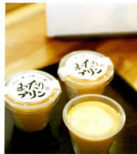
舌の上でとろける新感覚のまったりプリン (1個 ¥350)